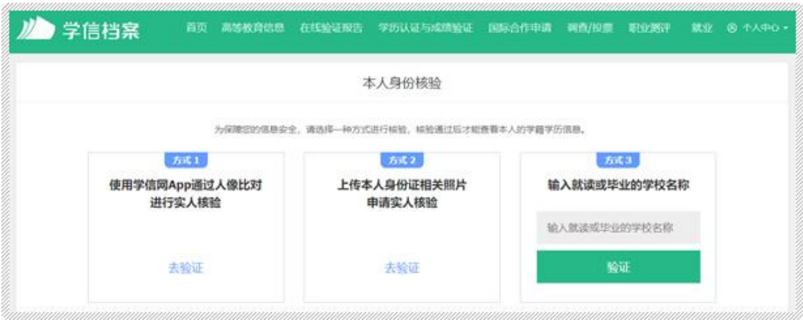
方式 1：使用学信网 App 通过人像比对进行实人核验